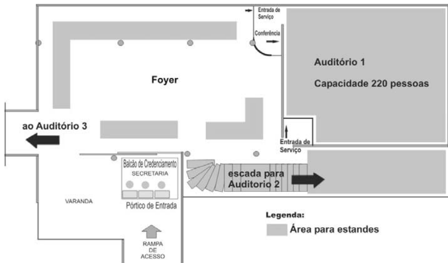
Diagrama esquemático do Espaço Cultural Arlindo Fragoso